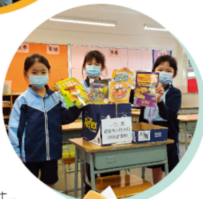
同學踴躍捐贈圖書