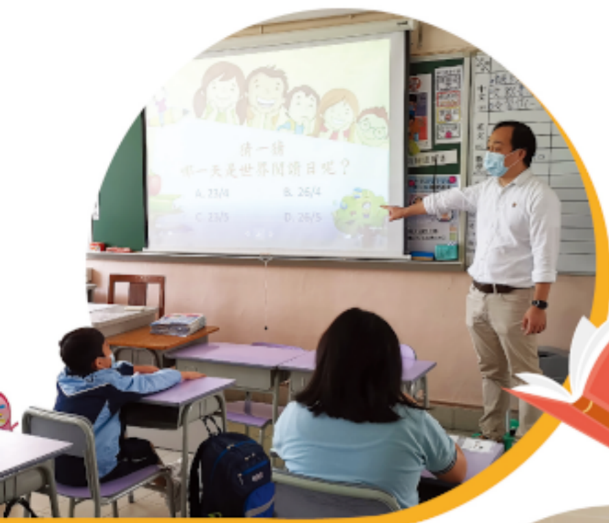
老師介紹「世界閱讀日」的由來

新的油麻地公共圖書館已於本年2月19日啟用，在此鼓勵各位家長與子女善用圖書館資源，養成閱讀習慣。